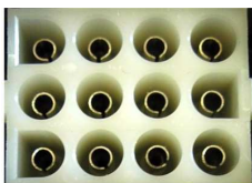
INGRESSO CAVO MULTIPOLARE MULTIPOLAR CABLE INLET

Collegare il connettore “maschio” della prolunga a 12 poli al connettore “femmina” presente sul quadretto. Join the “male” connector of 12-pin extension at the “female” connector on the electrical panel.